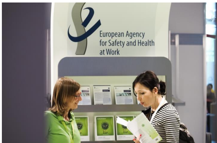
20. svetovni kongres o varnosti in zdravju pri delu leta 2014 v Frankfurtu

Eden od vrhuncev leta 2014 je bila udeležba EU-OSHA na 20. svetovnem kongresu varnosti in zdravja pri delu v Frankfurtu, ki je potekal od 24. do 27. avgusta. Agencija je na svoji stojnici predstavila portal OSHwiki, orodje OIRA in kampanjo Zdravo delovno okolje 2014–2015. Njeni predstavniki so sodelovali tudi v sedmih predstavitev, vključno s simpozijem o psihosocialnih tveganjih, ki ga je organizirala sama.