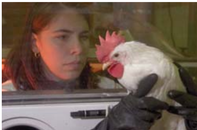
Европейски изследователи изучават вирусите на птичия грип, за да разработят нови ваксини — Istituto Zooprofilattico Sperimentale delle Venezie, Италия

Дори в XXI-ви век възникват нови патогени като ТОРС и птичия грип. Остри огнищни инфекции като холерата и жълтата треска също се проявяват отново.