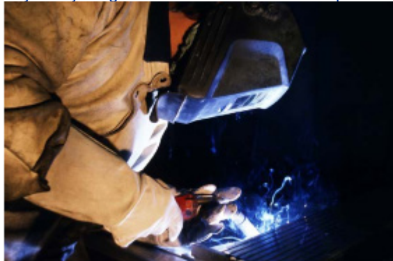
Figura 2: Dħaħen tal-iwweldjar li jikkontjenu gassijiet u fwar irritanti kif ukoll partikoli ultrafini