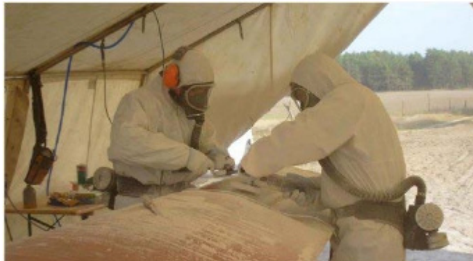
Figura 1: Laminazzjoni b'tiswija tal-ġwienaf ta' turbina eolika, KOOP