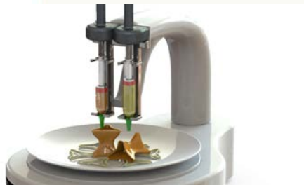
Impressão 3D de alimentos

A produção flexível e a liberdade de criação oferecem grandes oportunidades na área da indústria alimentar. Atualmente, a impressão 3D utiliza sobretudo alimentos líquidos, tais como o chocolate e a massa de crepe. Num futuro próximo, a impressão 3D será também utilizada para alimentos não cozinhados, os quais serão posteriormente sujeitos a tratamentos como aquecimento, ou transformados por processos naturais, como a fermentação ou germinação. Nessa fase, levantar-se-ão novos desafios em matéria de higiene, segurança e condições gerais de trabalho (ar puro, ergonomia, etc.).