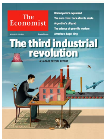
The Economist, abril de 2012

Nessa altura, previa-se que todas as casas estivessem brevemente equipadas com uma impressora 3D. Isso significaria o fim da produção em massa. Mais precisamente, aquilo que o The Economist previu foi uma pós-revolução industrial. Qualquer pessoa poderia descarregar a matriz digital de um produto a partir da internet e imprimi-la em casa carregando apenas num botão. Esta tecnologia permitiria ainda fazer alterações ao produto: por exemplo, uma pessoa com pés largos poderia facilmente imprimir um sapato ligeiramente mais largo. Este produto único e personalizado teria um custo semelhante ao de um produto fabricado em massa numa fábrica chinesa, o que acabaria por abalar o status quo do setor da produção. Verificar-se-ia também uma redução na procura de produtos novos decorrente da generalização dos trabalhos de reparação, uma vez que as peças necessárias à reparação dos aparelhos danificados poderiam ser facilmente descarregadas em casa a partir de uma impressora 3D. Considerando a transferência da produção para o contexto doméstico, o dispêndio de tempo e energia na distribuição dos bens seria limitado. Além disso, acabaria por ser ainda repensada a relação entre oferta e procura, pois as pessoas imprimiriam apenas aquilo de que precisariam. Tal significaria o fim dos stocks e da sobreprodução. Esta nova revolução industrial poderia também ser ecológica. 12