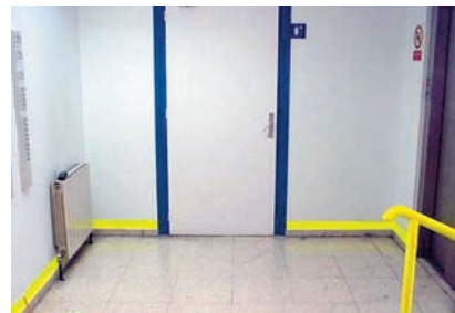
Il-Kuntrast fil-Kulur jgħin il-mobilità