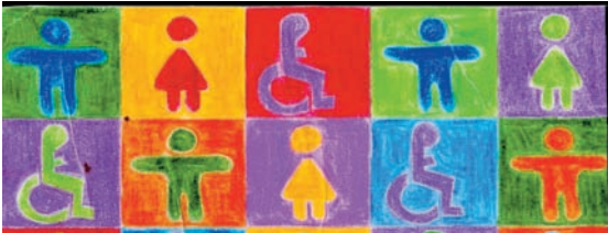
Tipiġija ta' Marina Wiriltsch, is-Sena Ewropea ta' Persuni b'Dizabilitajiet 2003

Persuni b'dizabilitajiet għandhom jirċievu trattament ugwali fuq il-post tax-xogħol. Dan jinkludi ugwaljanza fir-rigward tas-saħħa u tas-sigurtà fuq il-post tax-xogħol. Is-Saħħa u s-sigurtà m'għandhomx jintużaw bħala skuża sabiex persuni b'dizabilità ma jiġux impjegati jew ma jibqgħux jiġu impjegati. Barra minn hekk, post tax-xogħol li hu aċċessibbli u sigur għal persuni b'dizabilitajiet huwa wkoll iktar sigur u iktar aċċessibbli għall-impjegati, għall-klijenti u għall-visitaturi kollha. Persuni b'dizabilitajiet huma koperti kemm minn leġislazzjoni Ewropea kontra d-diskriminazzjoni, kif ukoll minn leġislazzjoni tas-saħħa u tas-sigurtà fuq il-post tax-xogħol. Din il-leġislazzjoni, li l-Istati Membri jimplimentaw f'leġislazzjoni u f'arranġamenti nazzjonali, għandha tiġi applikata sabiex tiffaċilita l-impjieg ta' persuni b'dizabilitajiet, sabiex dawn ma jiġux esklużi.