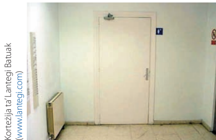
Korteżija ta' Lantegi Batuak (www.lantegi.com)