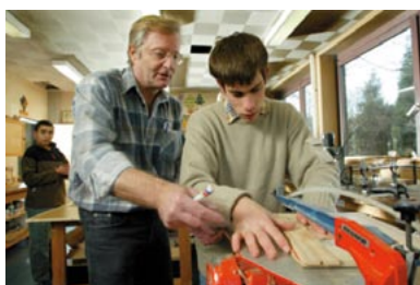
Europos bendrija, 2006 m.

Didesnį nelaimingų atsitikimų ir minėtų sveikatos problemų mastą galima paaiškinti jaunų darbuotojų patirties stoka, fiziniu ir psichologiniu nebrandumu, sveikatos ir saugos problemų nepakankamu suvokimu, taip pat darbdavių aplaidumu, neužtikrinant tinkamo darbuotojų mokymo, priežiūros ir apsaugos ir nesuteikiant tinkamų jaunų žmonių darbo sąlygų. Būtina tinkamai atsižvelgti į riziką, su kuria jauni darbuotojai susiduria darbe. Į daugelį rizikos veiksnių vis dar žiūrima kaip į pačių darbuotojų rizikingo elgesio ar laikino darbo pobūdžio padarinių.