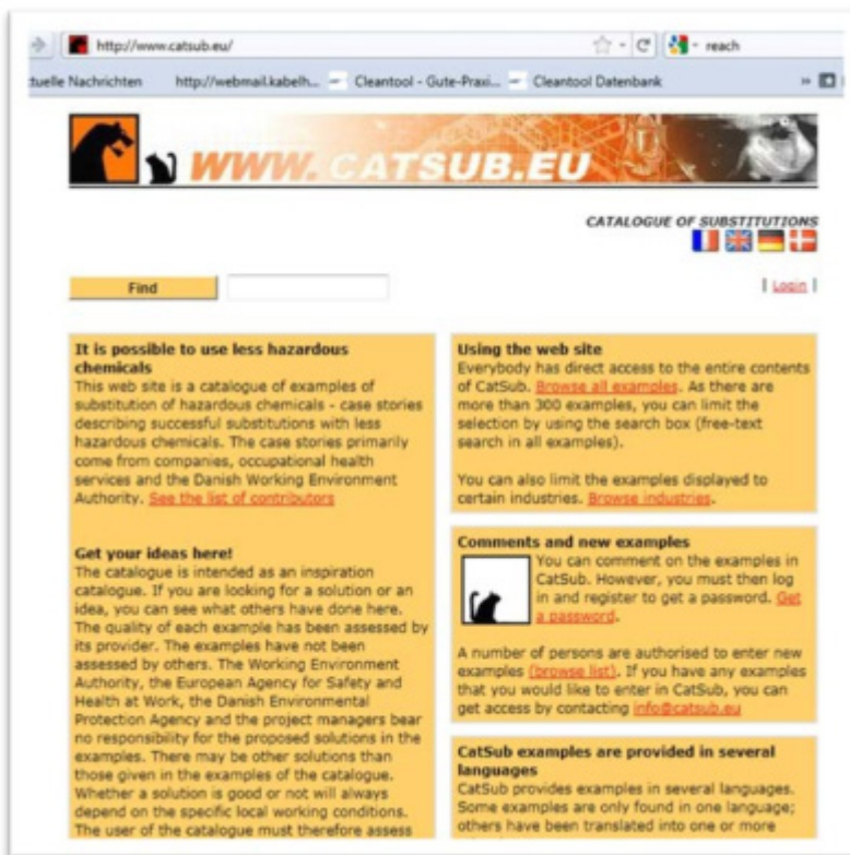
5. ábra: CatSub adatbázis – képernyőfelvétel, KOOP