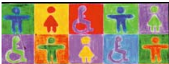
Zeichnung von Marina Wirlitsch, Europäisches Jahr der Menschen mit Behinderungen 2003

Menschen mit Behinderungen haben Anspruch auf Gleichbehandlung am Arbeitsplatz. Dazu gehört die Gleichstellung in Fragen der Sicherheit und des Gesundheitsschutzes bei der Arbeit. Sicherheit und Gesundheitsschutz sollten nicht als Vorwand dafür dienen, Behinderte nicht oder nicht mehr zu beschäftigen. Hinzu kommt, dass ein Arbeitsbereich, der für Menschen mit Behinderungen leicht zugänglich und sicher ist, auch für alle anderen Beschäftigten sowie für Kunden und Besucher sicherer und besser zugänglich ist. Sowohl die europäischen Rechtsvorschriften zur Antidiskriminierung als auch jene im Bereich Sicherheit und Gesundheitsschutz integrieren die Belange der Behinderten. Diese Rechtsvorschriften, die von den Mitgliedstaaten in innerstaatliche Gesetze und Regelungen umgesetzt werden, sollten genutzt werden, um die Beschäftigung von Menschen mit Behinderungen zu erleichtern, nicht aber um sie auszugrenzen.