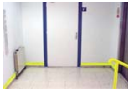
Farbkontraste fördern die Mobilität