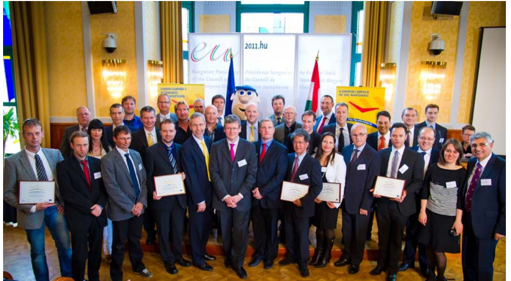
Sigurveggar Evrópuverðlauna fyrir góða starfshætti taka á móti viðurkenningarskjöllum

Herferðirnar “Vinnuvernd er allra hagur” eru þær stærstar sinnar tegundar í heiminum, en þær ná til EFTA landanna, umsóknarlanda og aðildarríkja ESB. Við höldum áfram starfinu við að ná til milljóna evrópskra starfsmanna en nýjasta herferðin, sem sett hefur þátttökumet, miðar að því að auka vitund fólks um mikilvægi viðhalds fyrir öryggi og heilbrigði starfsmanna og mikilvægi þess að það sé framkvæmt með öruggum hætti. Nýsköpunar fyrirtæki hlutu einnig viðurkenningu á verðlaunaafhendingu 10. Evrópuverðlauna fyrir góða starfshætti , sem afhent voru í Búdapest á heimsdegi vinnuverndar.