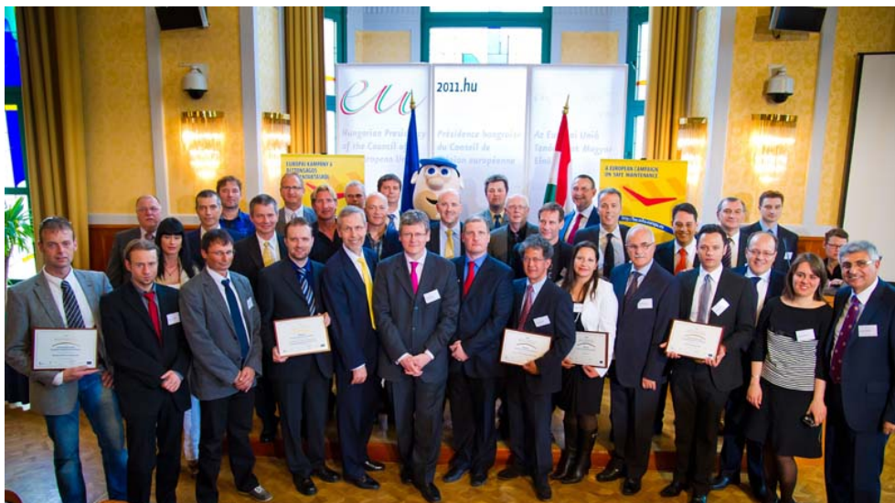
Hea tava auhinna võitjad oma tunnistusi vastu võtmas.

2011. aasta oli ohutule hooldusele pühendatud tervislike töökohtade kampaania teine ja viimane aasta. Tervislike töökohtade kampaaniad on maailmas suurimad omataolised – neid korraldatakse EFTA riikides, ühinemiseks valmistuvates riikides ja kandidaatriikides, samuti ELi riikides. Miljonitele Euroopa töötajatele suunatud viimases kampaanias oli rekordarv osalejaid. Kampaania eesmärk oli tõsta teadlikkust hooldustööde tähtsusest töötajate ohutusele ja tervishoiule ning vajadusest teostada hooldustöid ohutult. Samuti tunnustati uuenduslikke ettevõtteid ja organisatsioone 10. Euroopa hea tava auhinnaga , mis anti üle Budapestis ülemaailmsel tööohutuse ja töötervishoiu päeval.