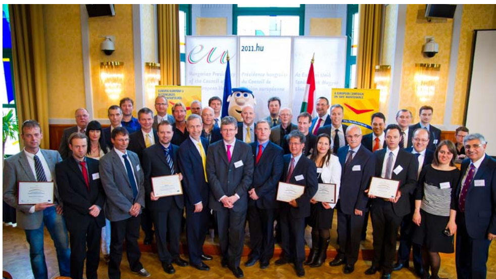
Les gagnants du prix des bonnes pratiques ayant reçu leur certificat.

2011 a été la seconde et dernière année de la campagne «Lieux de travail sains» dédiée à la maintenance sûre . Les campagnes «Lieux de travail sains» constituent à présent les plus importantes du genre dans ce domaine au niveau mondial et concernent les pays de l'AELE, les pays en phase de préadhésion, les pays candidats ainsi que les pays membres de l'UE. Atteignant toujours des millions de travailleurs européens, la dernière campagne a enregistré des taux record de participation et visait à sensibiliser à l'importance de la maintenance pour la santé et la sécurité des travailleurs ainsi qu'à la nécessité de l'effectuer en toute sécurité. Des entreprises innovantes ont également été récompensées à l'occasion du 10 e Prix européen des bonnes pratiques , qui a été remis à Budapest, lors de la Journée mondiale de la sécurité et de la santé au travail.