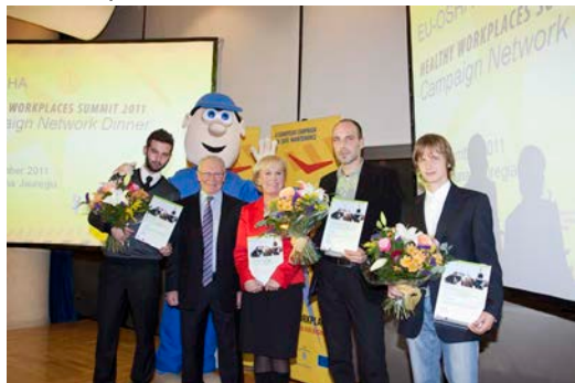
Les gagnants du concours photo et le jury

Enfin, les futures avancées des travaux de l'Agence seront abordées dans une nouvelle stratégie de l'EU-OSHA qui sera établie en 2012, en vue d'être adoptée en 2013.