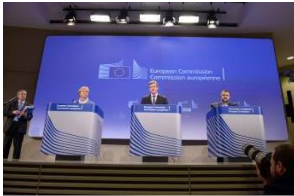
Christa Sedlatschek, directeur van EU-OSHA, László Andor, commissaris voor Werkgelegenheid, Sociale Zaken en Inclusie, Vasilis Kegeroglou, de Griekse onderminister van Arbeid, Sociale Zekerheid en Welzijn en vertegenwoordiger van het Griekse voorzitterschap van de Raad van de Europese Unie, tijdens de persconferentie waarmee de campagne 'Een gezonde werkplek' in april 2014 in Brussel van start ging.

De campagne 'Een gezonde werkplek 2014-2015 — Gezond werk is werk zonder stress!', werd op 7 april bij de Europese Commissie in Brussel gelanceerd. De website van de campagne, met materiaal in 25 talen, werd diezelfde dag in bedrijf gesteld. Een dag later werd een partnerschapsbijeenkomst voor de campagne gehouden en werd het officiële aanbod om campagnepartner te worden gepresenteerd. Meer dan honderd campagnepartners sloten zich bij het programma aan, en meer dan dertig mediapartners hielpen mee om de campagne te promoten.