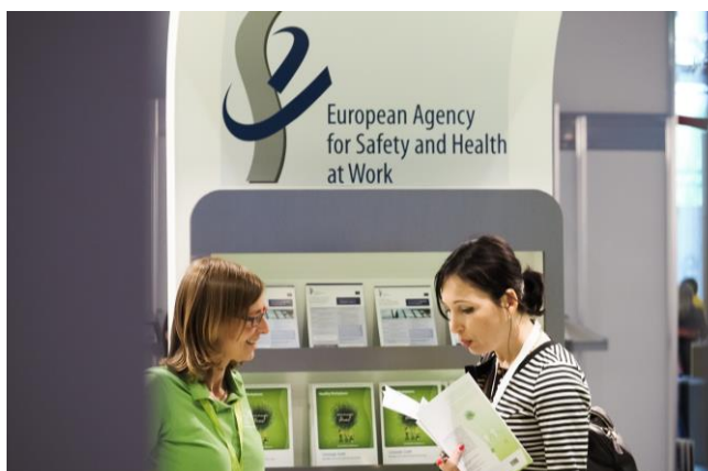
20e Wereldcongres over veiligheid en gezondheid op het werk, 2014, Frankfurt

Een van de hoogtepunten van 2014 was de aanwezigheid van EU-OSHA op het 20e Wereldcongres over veiligheid en gezondheid op het werk van 24 t.e.m. 27 augustus in Frankfurt. Op de stand van EU-OSHA werden OSHwiki, OiRA en de campagne 'Een gezonde werkplek 2014-2015' onder de aandacht gebracht. Medewerkers van EU-OSHA waren betrokken bij zeven sessies, waaronder een symposium over psychosociale risico's, dat door het Agentschap werd georganiseerd.