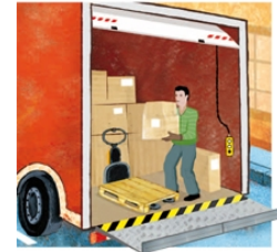
Transport routier de marchandises Guide pour l'évaluation des risques professionnels