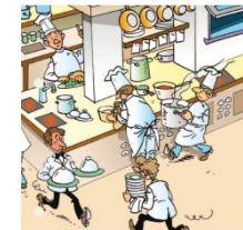
La restauration traditionnelle Prévention des risques professionnels