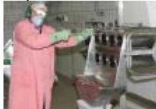
Fig 3: Tbatil tar-rotors bi trolji li jdur fuq pern

Fl-ewwel tliet snin ta' l-EGC ir-rata ta' aċċidenti naqset b'29%, waqt li l-ġranet ta' assenza minħabba mard naqsu b'madwar 50%. L-EGC jista' jintuża f'forma adattata fil-kumpaniji kollha. Is-suċċess kien dovut minħabba fl-aċċess dirett għall-kumpanija u għall-integrazzjoni tas-sistema ta' suġġerimenti. Adattazzjonijiet meħtieġa għal kumpaniji oħrajn jikkonċernaw l-enfasi tas-seba' kwistjonijiet ergonomiċi.