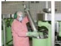
Fig 1: Ġbid tar-rotor b'għodda ta' rfiġ marbuta mas-saqaf

Wara: ir-rotor huwa merfugħ b'għodda ta' rfiġ marbuta mis-saqaf (fig 1), u jitqiegħed fi trolji speċjali. Jistgħu jiġu trasportati u mmanipulati b'dan il-mod sa massimu ta' tmien rotors (fig 2). Dawn jitbattlu billi titmejjel il-parti ta' fuq tat-trolji bir-rotors mingħajr pożizzjonijiet u movimenti skomdi (fig 3) bi frazzjoni ta' l-isforz tat-tqandil manwali.