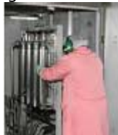
Fig 2: Trasport ta' 8 rotors bit-trolji