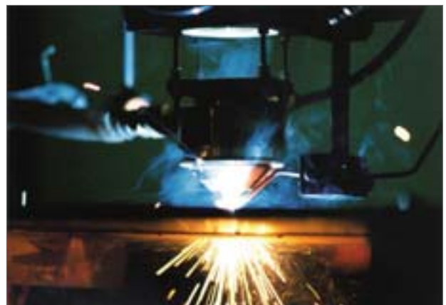
Bei der Werkstoffbearbeitung mit dem Laser entstehen ultrafeine Partikel, Berufsgenossenschaftliches Institut für Arbeitsschutz, Deutschland