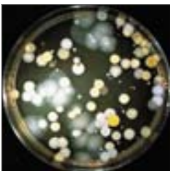
Schimmel auf Abluftfilter, Berufsgenossenschaftliches Institut für Arbeitsschutz, Deutschland